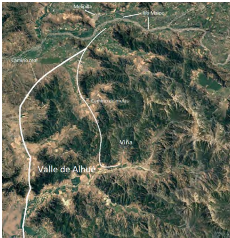
Figura 2. Valle de Alhué, viña y caminos hasta el río Maipo Figure 2. Alhué's valley, vineyard and roads untill Maipo's river