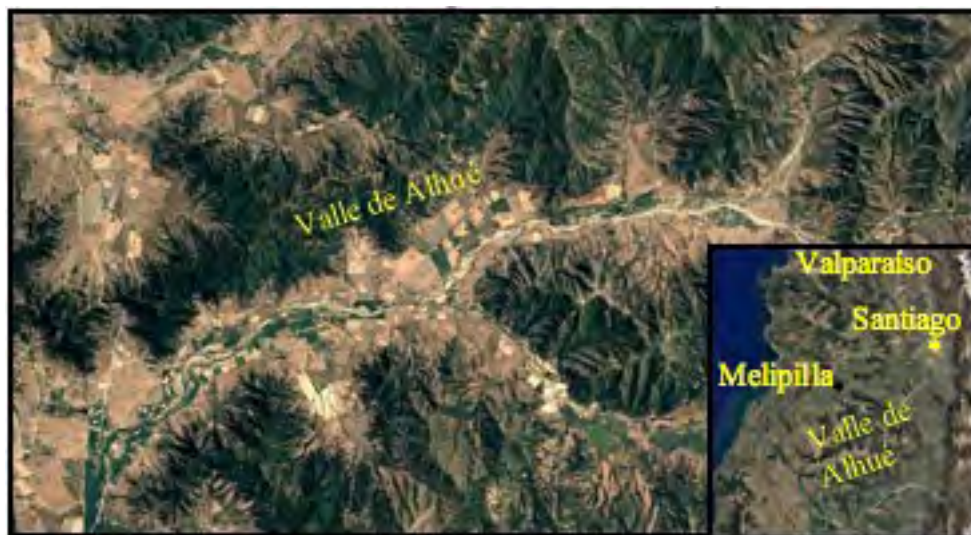
Figura 1. Valle de Alhué Figure 1. Alhué’s Valley