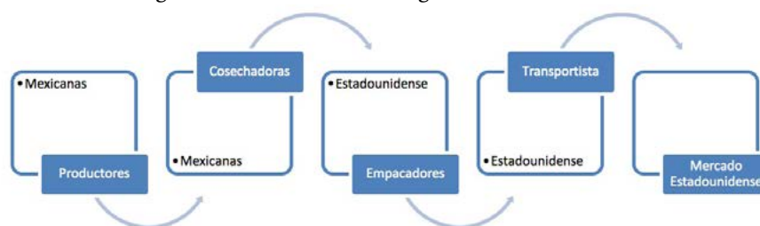
Figure 1. Avocado business conglomerate in Michoacán