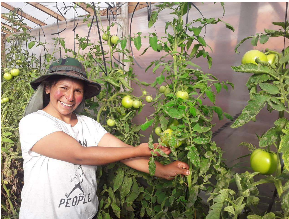
Figura 5. Integrante del Movimiento Evita en el barrio La Herradura Figure 5. Member of the Evita Movement in La Herradura neighborhood