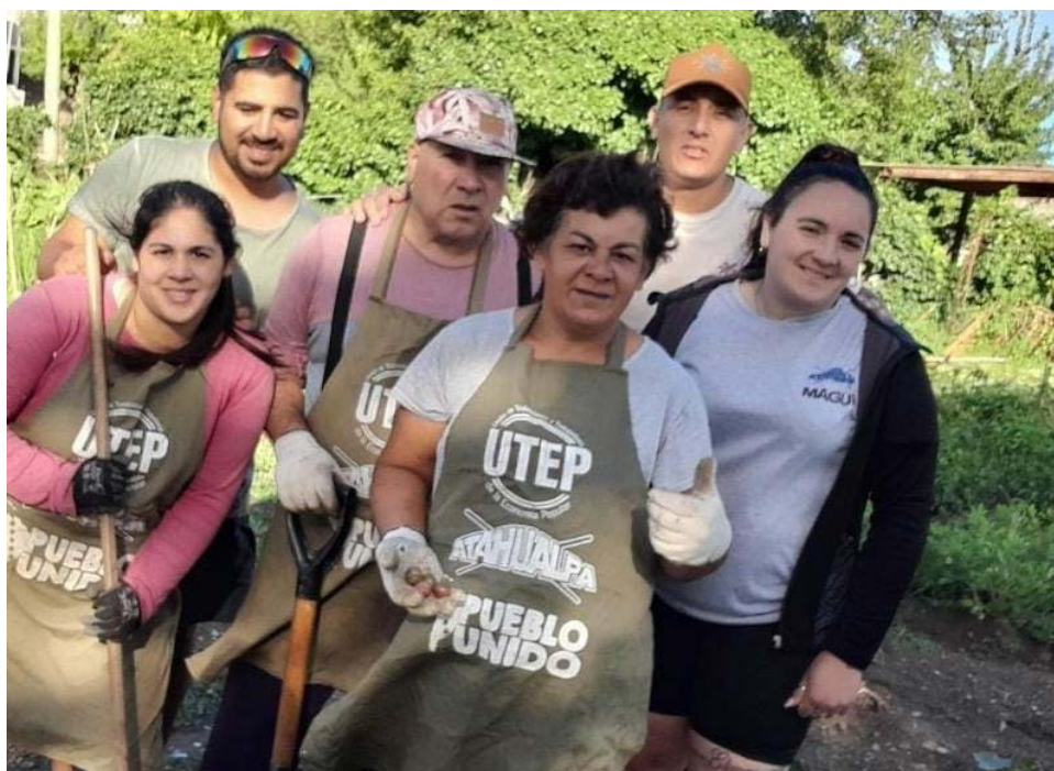
Figura 4. Integrantes del Movimiento Atahualpa en el barrio Virgen de Luján Figure 4. Members of the Atahualpa Movement in the Virgen de Luján neighborhood