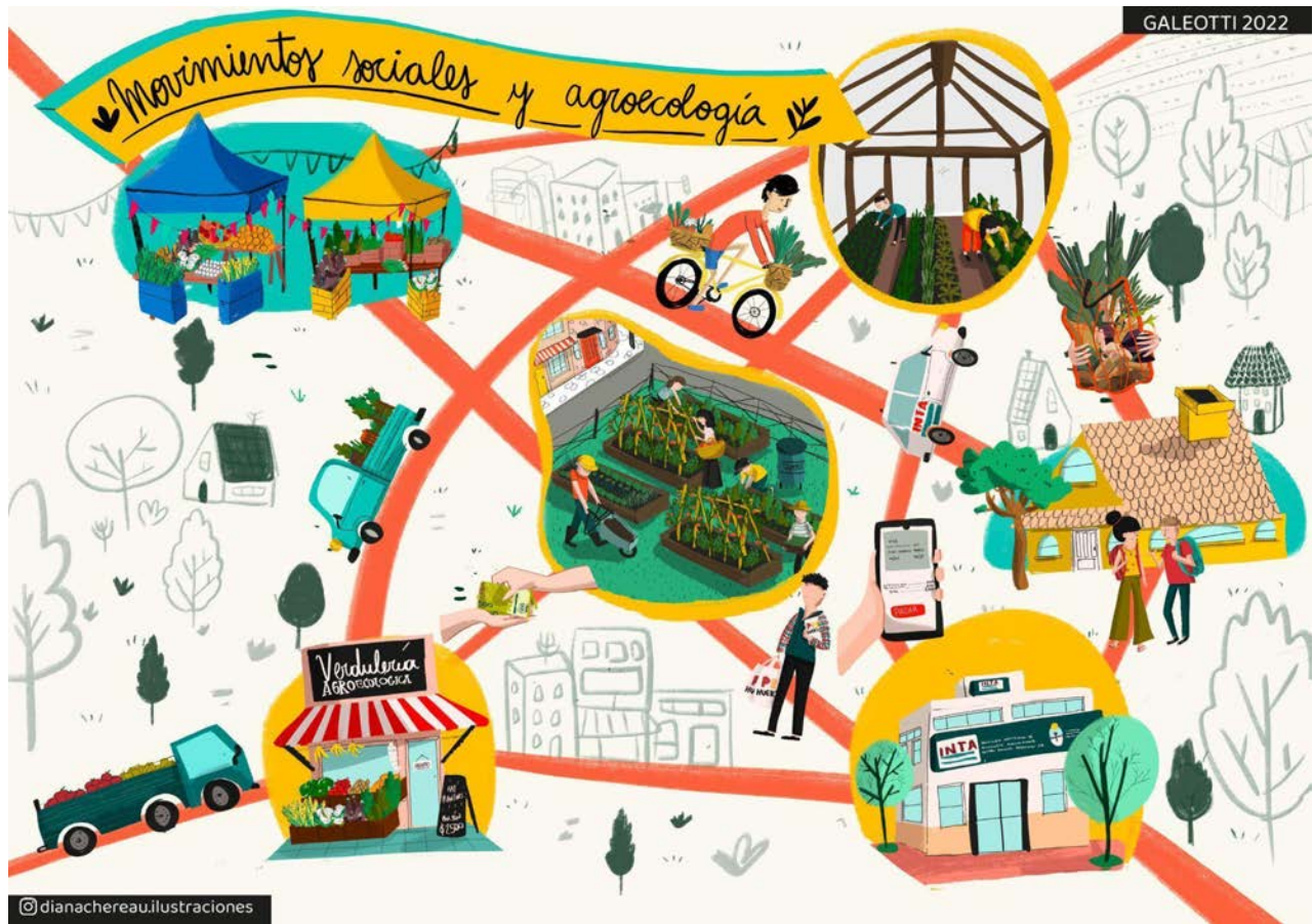
Figura 1. Redes agroalimentarias alternativas agroecológicas Figure 1. Agroecological alternative agri-food networks

Fuente: ilustración de Diana Chereau. Source: illustration of Diana Chereau.