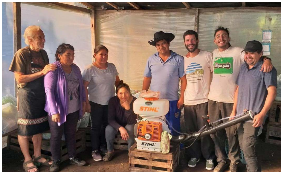
Figura 3. Integrantes de la Cooperativa de Productores Agroecológicos de Mar del Plata Figure 3. Members of the Mar del Plata Agroecological Producers Cooperative