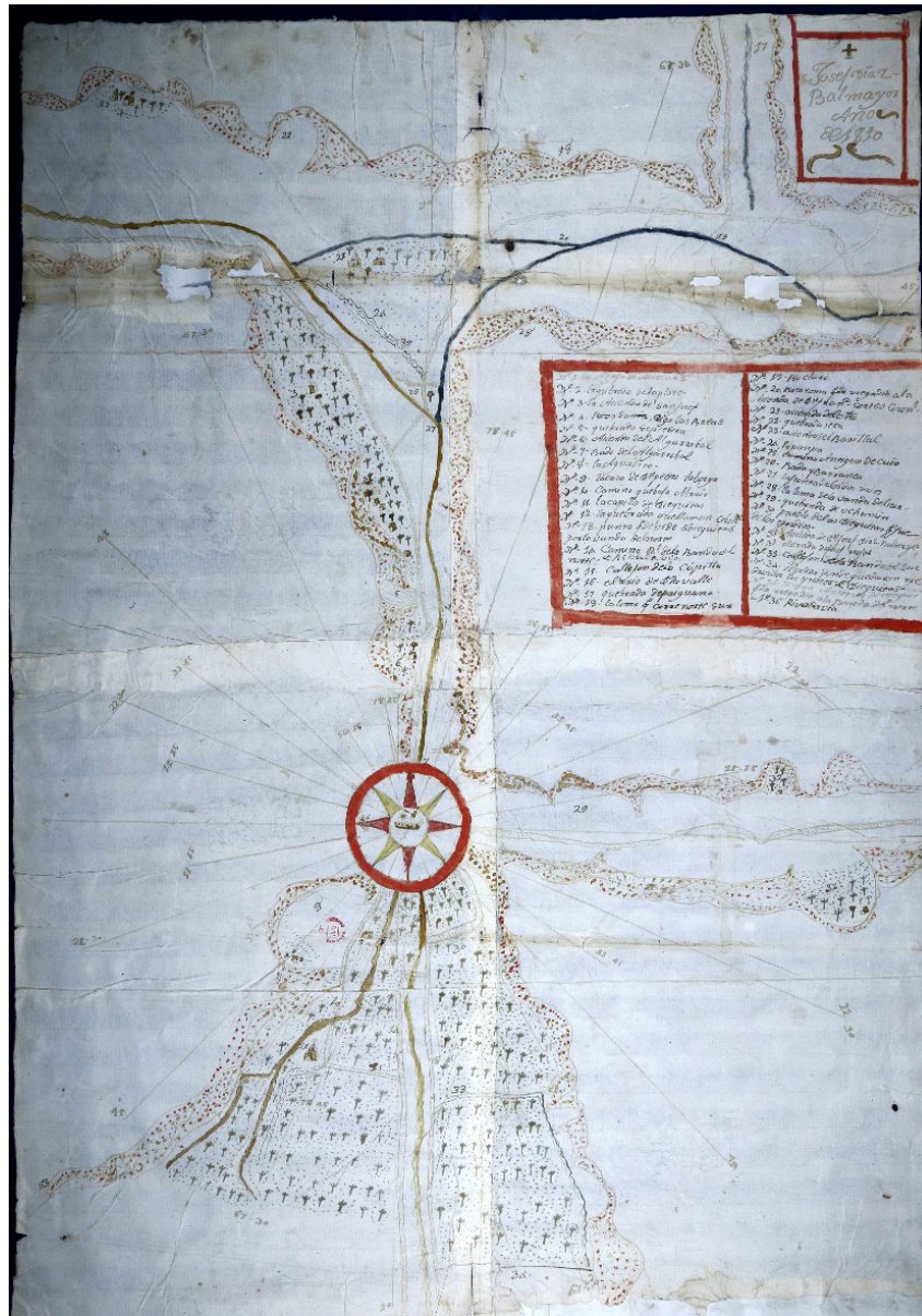
Figure 1. Elqui Valley map, 1810. José Díaz de Balmayor